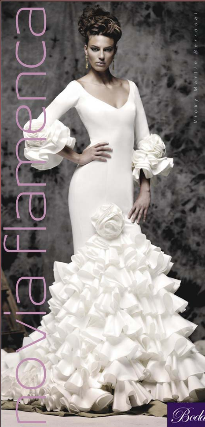
Vicky Martín Berrocal