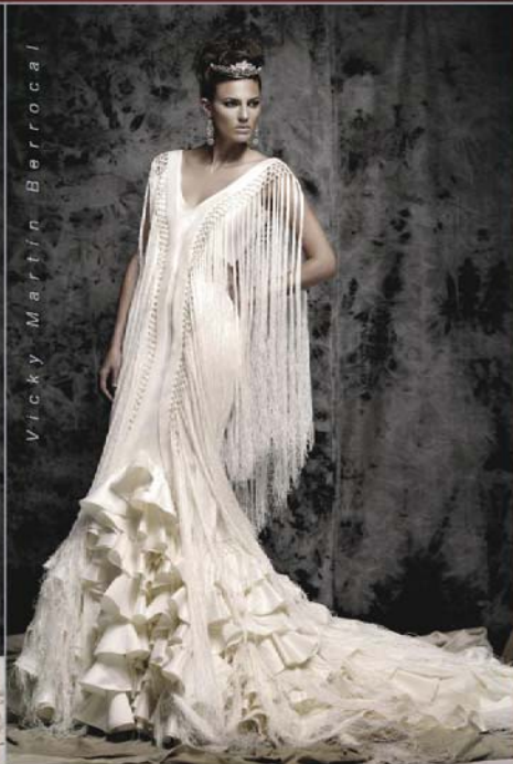
Vicky Martín Berrocal