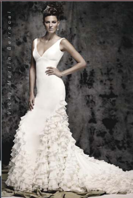
Vicky Martín Berrocal